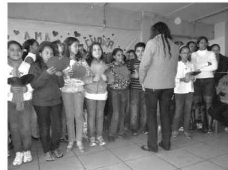
Alunos formaram um coro para o Dia das Mães

Nós tivemos a apresentação do dia das mães, que aconteceu com a apresentação de um coral de alunos no pátio da escola.