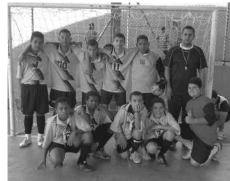
Nosso time disputou o campeonato estadual

O time de futsal disputou o campeonato estadual, mas não foi bem