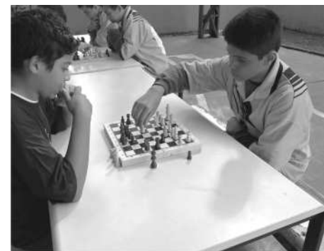
Também disputamos no xadrez

Participe você também dos eventos que vão acontecer.